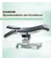
DIAMOND Operationstische der Extraklasse