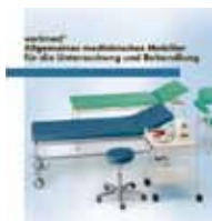
varimed® Allgemeines medizinisches Mobiliar für die Untersuchung und Behandlung