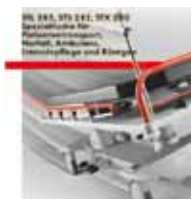
STL 285, STS 282, STX 280 Spezialtische für Patiententransport, Notfall, Ambulanz, Intensivpflege und Röntgen