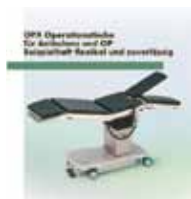
OPX Operationstische für Ambulanz und OP Beispielhaft flexibel und zuverlässig