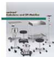
varimed® Ambulanz- und OP-Mobiliar