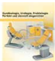
Gynäkologie, Urologie, Proktologie Perfekt und sinnvoll eingerichtet