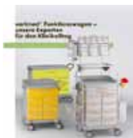
varimed® Funktionswagen – unsere Experten für den Klinikalltag