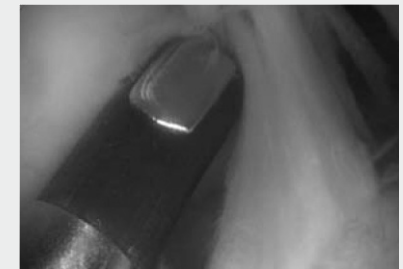
VAP in Anwendung in der Schulter