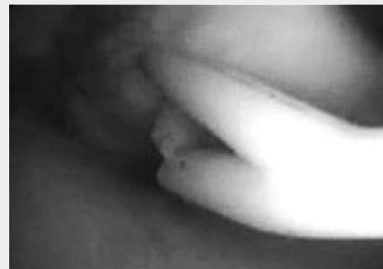
COBRA in Anwendung bei einer Meniskus-OP