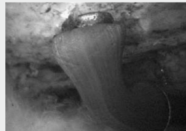
PHAZER in Anwendung bei einer Hüft-OP